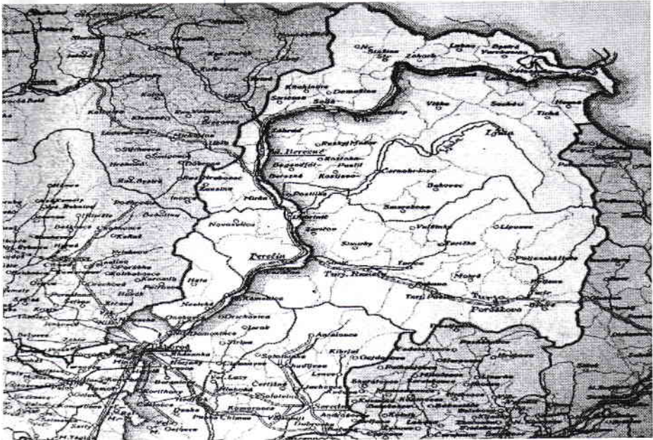
Fig. 12. Granița administrativă dintre Slovacia și Rusia Subcarpatice;

De asemenea, paragraful 48 al Tratatului de pace de la Trianon stipula includerea „teritoriului rutenilor de la sud de Carpați” în componența Republicii Cehoslovace: „Ungaria recunoaște, precum au făcut-o deja Puterile Aliate și Asociate, deplina independență a statului cehoslovac care va cuprinde și teritoriul autonom al rutenilor de la sudul Carpaților” 19 . Între anii 1919-1921, acordurile internaționale cu privire la Rutenia Subcarpatică au fost implementate în legislația internă a țării, prin: constituție, diferite memorandumuri (cu modificări și completări), statutul general (cu