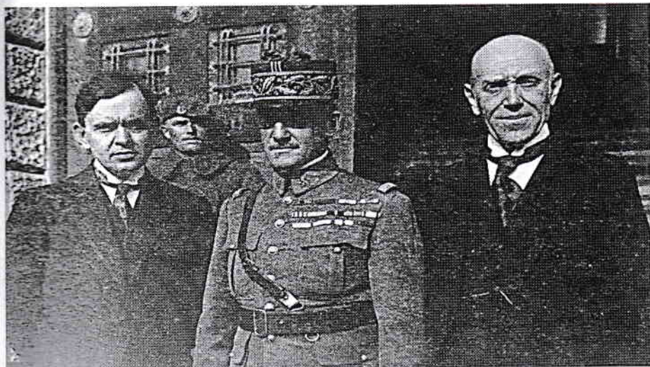
Fig. 11. De la stânga la dreapta: Hrihoriy Zhatkovych – primul guvernator al Rusiei Subcarpațece, generalul Marie Parish – comandantul corpului de armată cehoslovac din Ujhorod în perioada 1919–1922, viceguvernatorul Rusiei Subcarpațece Petro Ehrenfeld, 1920, lângă clădirea gimnaziului de stat;